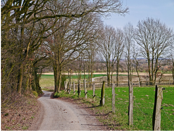
Typische Landschaft Münsterland

Im Durchschnitt aller fünfzig Jahre seiner ehrenamtlichen Tätigkeit führte Herz Azor jährlich sechs Beschneidungen durch.